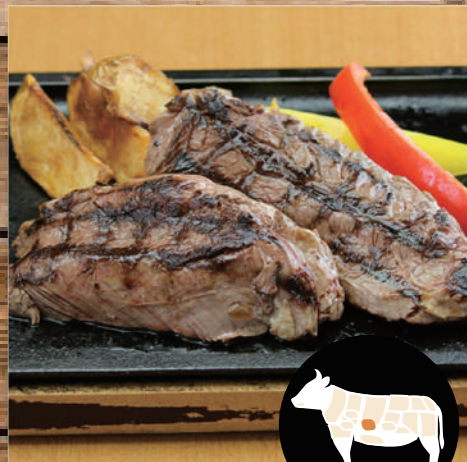
ブラックアンガス ハラミのグリル