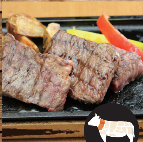
ブラックアンガス ざぶとんのグリル