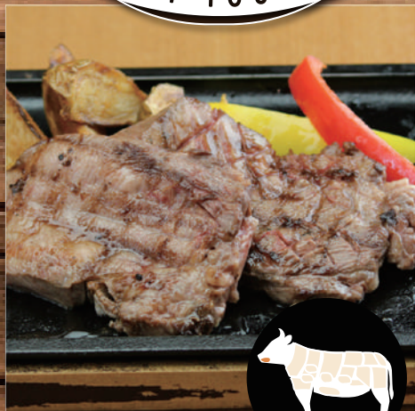
ブラックアンガス 牛舌のグリル