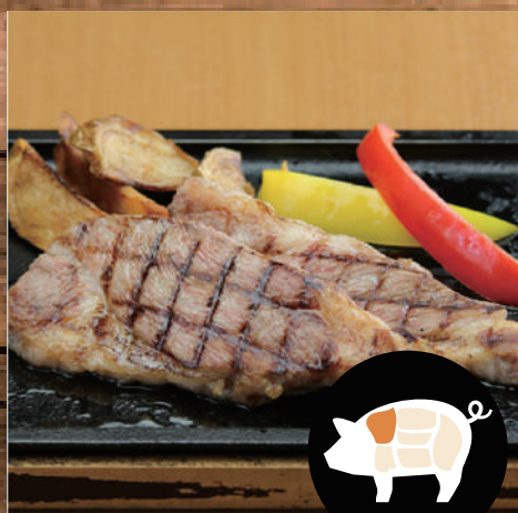
イベリコ豚“ランクベジョータ” 肩ロースのステーキ