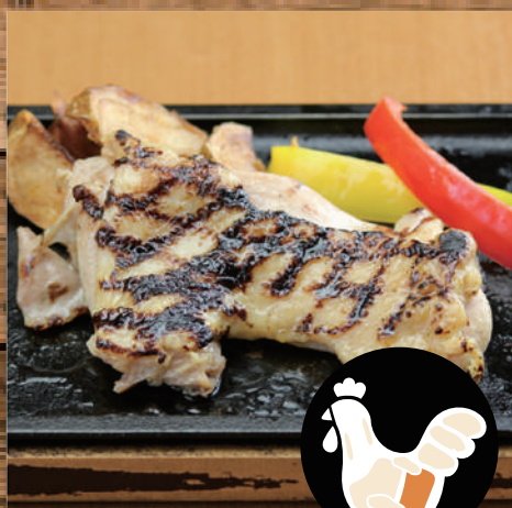
匠の大山鶏ももの ステーキ